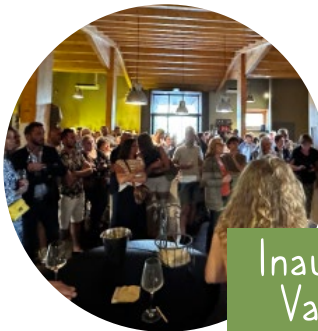
Inauguration de la cuvée Valoise Saint-Georges