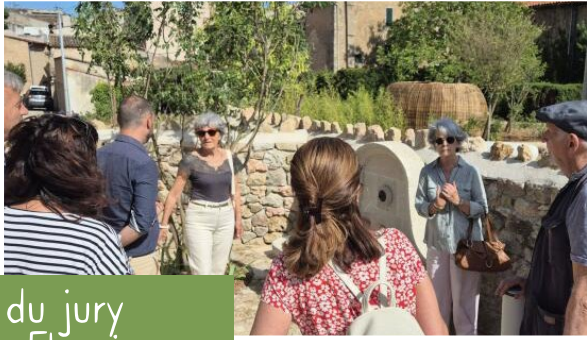
Visite du jury «Villages Fleuris»