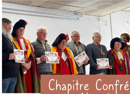
Chapitre Confrérie à Néoules